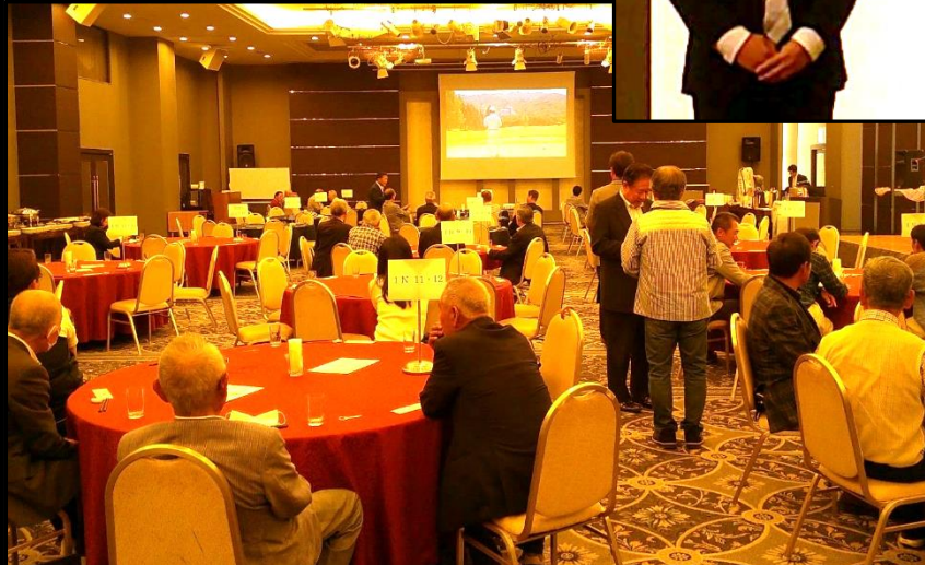
←2番のショートコースの映像を流しながらの表彰式会場 (呉森沢ホテル)